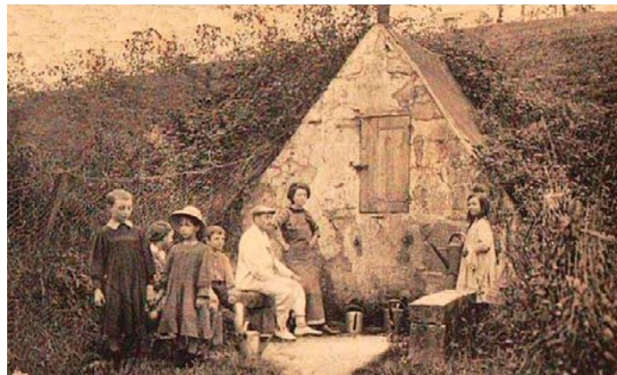
Huisjes van Cagots