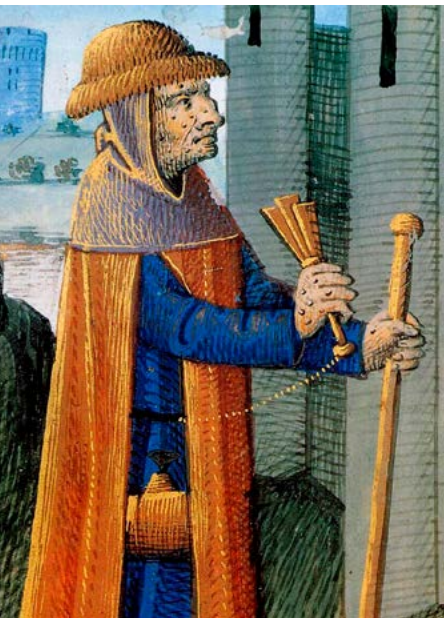
Lepralijder kondigt zijn komst aan

het scheermes wisten te hanteren. In relatie tot onderzoeken met betrekking tot de Cagots, wordt Paré in diverse bronnen aangehaald. Hij zou tijdens het bestuderen van deze wat afwijkende mensvorm ontdekt hebben dat zij mumificatie door magnetisme beoefenden. Hun enorm hoge lichaamstemperatuur bleek in een oogwenk een op hun hand gelegde verse appel te kunnen laten verschrompelen, alsof zo'n vrucht minstens acht dagen in de zon had gelegen!