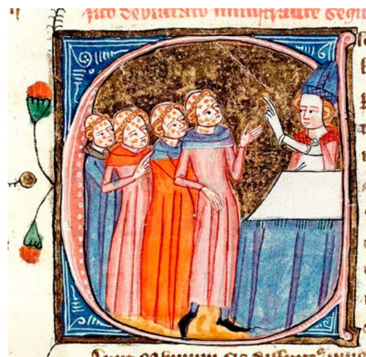
Lepralijders worden gezegend

lucht is komen vallen. Franse ufo-onderzoekers leggen de link met een in de Franse Bibliothèque Nationale gevonden manuscript waarin Aartsbisschop Agobard (779-840) beschrijft hoe in het jaar 800 de stad Lyon werd aangevallen door wezens in vreemde, zwevende schepen die buitengewone trillingen veroorzaakten. In 842 zouden deze wezens zijn teruggekomen. Op diverse Franse ufo-fora wordt er druk gespeculeerd dat dit de Cagots kunnen zijn geweest. Dat het hier een humanoïde-achtig buitenaards ras betreft, is geen gekke gedachtegang. Sterrengoden werden in China en Japan beschreven als wezens met een bleke, witte huid, veel oude Hindoegoden worden melkwit afgebeeld en over de aanwezigheid van aliens in de grotten van de Pyreneeën wordt al een eeuwigheid gespeculeerd. Dat zouden dan buitenaardsen zijn die vanwege hun huid niet goed tegen zonlicht kunnen en daarom hun heil zoeken op dit soort donkere koele plekken, zodat ze minder last hebben van de temperatuurwisselingen op aarde. Als we hier te maken hebben met een buitenaards ras, dan is het zelfs mogelijk dat er mensen in het berggebied van Frankrijk en Spanje leven die nazaten of kruisingen kunnen zijn van deze aliens.