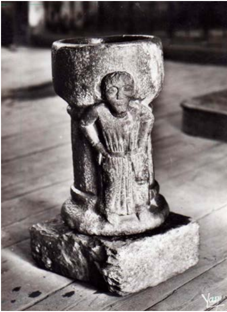
Wijwaterbekken voor Cagots

‘Wanneer een Cagot zijn vinger in de algemene wijwaterbak stak, moest hij een hand afstaan’