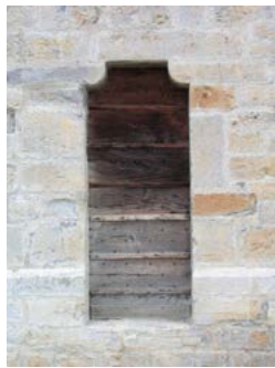
Eigen ingang kerk

clapspaen , waarvan later het woord klikspaan is afgeleid. Sommige kerken in Zuid-Frankrijk bezitten nog een aparte toegangsdeur die de Cagots gebruikten, omdat ze alleen maar bij elkaar in een eigen gedeelte mochten zitten. Wanneer een Cagot zijn vinger in de algemene wijwaterbak stak, moest hij een hand afstaan. De afgehakte hand werd dan op de kerkdeur vastgespijkerd. Elizabeth Gaskell, die realistische verhalen schreef die onder andere in de magazines van Charles Dickens verschenen, publiceerde in 1855 het artikel An Accursed Race . Ze doet daarin een boekje open over de Cagots, die honderden jaren in afzondering leefden en waarvan alle onderscheidende sporen over hun verleden verloren bleken. In haar betoog vertelt ze dat de Cagots niet voor zonsopgang binnen de straten of poorten van dorpen mochten komen en er evenmin iets eetbaars mochten kopen. Kinderen naaiden schapenstaarten aan de jurken van de Cagots, puur om ze te pesten. Ze moesten een voet van een eend of gans over hun linkerhand hangen. Later werd dit veranderd in een gele badge in de vorm van een eenden- of ganzenvoet. Droeg een Cagot zijn teken niet, dan moest hij betalen, verloor hij zijn kleding en moest hij naakt huiswaarts keren.